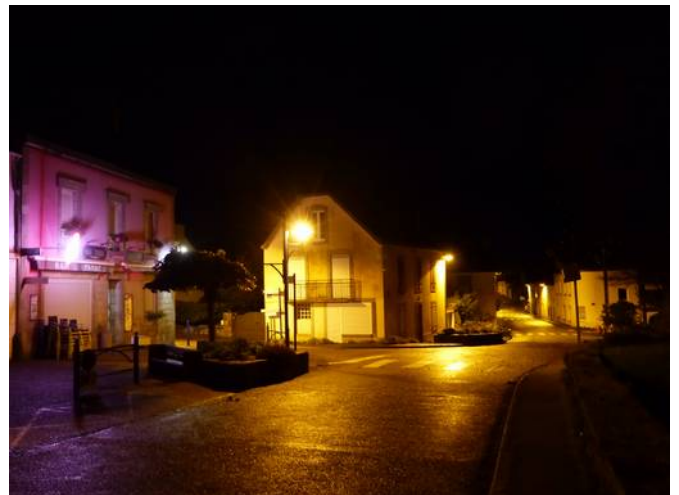
Pouldregad deus noz

Éclairage public. Ce poste est le deuxième consommateur d'électricité de la commune (13 000 Kw/an pour 7850€ en 2021). Dans l'objectif de poursuivre les économies d'énergie déjà mises en place grâce vos efforts et ceux de la commune (passage aux leds, suivi des consommations, minuteur, mise en place de thermostats), le conseil municipal a décidé de modifier les plages horaires de l'éclairage public. En période hivernale (du 1 er octobre au 30 avril), dans les quartiers, les lampadaires seront allumés de 6h du matin au lever du jour et de la tombée du jour à 22h du lundi au vendredi, pas d'allumage le week-end. Dans le centre bourg (route de Douarnenez et rue ar Stêr), ils resteront allumés jusqu'à 23h et cela toutes les nuits de la semaine. En période estivale (du 1 er mai au 30 septembre), seul le centre-bourg sera éclairé, de la tombée du jour à 23h et de 6h au lever du jour. Ces horaires pourront subir des modifications ponctuelles en cas d'alerte Ecowatt (tension sur le réseau) ou de fêtes ou manifestations sur la commune. Bon à savoir également : l'extinction nocturne participe également à la protection des écosystèmes et de la biodiversité. N'hésitez pas à nous envoyer votre avis concernant ces nouveaux horaires.