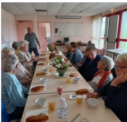
Le Club accueille avec plaisir de nouveaux membres.

posées par le monde associatif de Pouldergat : une grande diversité de choix. Les bénévoles vous présenteront leurs animations tout au long de l'année et chacun(e) peut trouver ce qui lui convient. Le stand de la Mairie présentera le «Budget participatif».