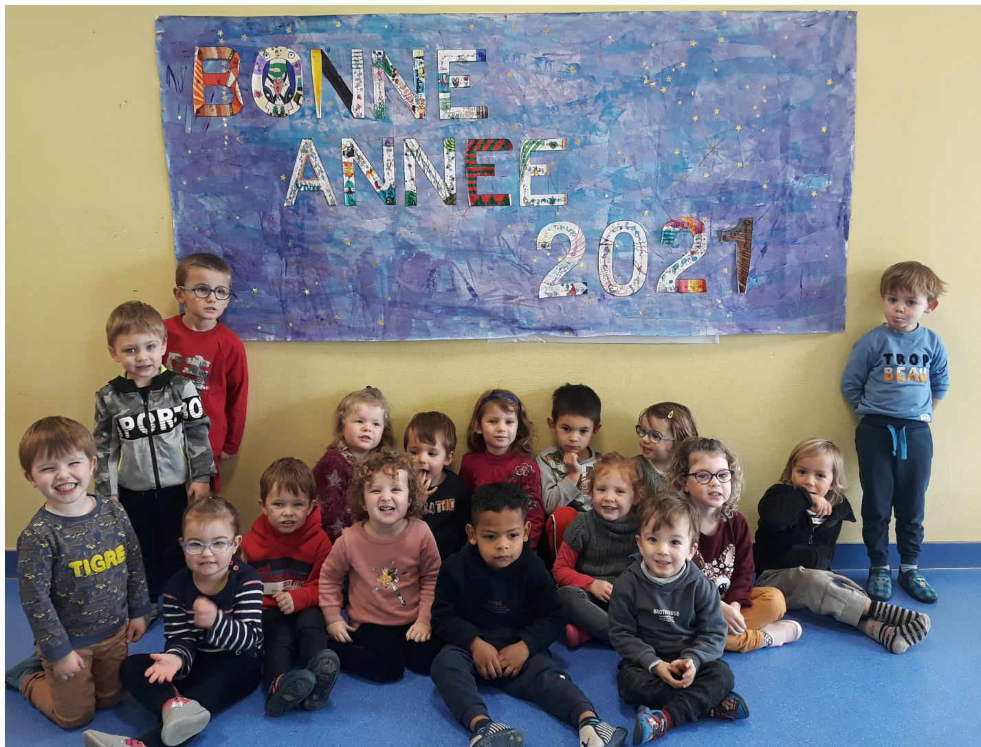
Les enfants des classes de TPS/PS/MS. La fresque a été réalisée par les élèves de GS/CP et CM1/CM2.

Mairie de Pouldergat / 02 98 74 61 26 / www.pouldergat.fr / pouldergat.mairie@wanadoo.fr