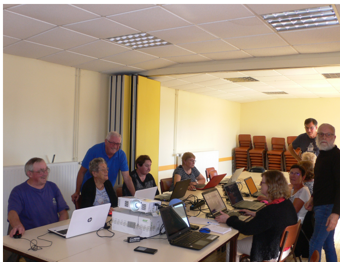
Les Geeks attendent la rentrée

Une préinscription peut déjà se faire soit à la Mairie de Pouldergat soit par courriel auprès de Joël Larvor : pouldergeek@orange.fr