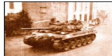
Libération de Pouldavid