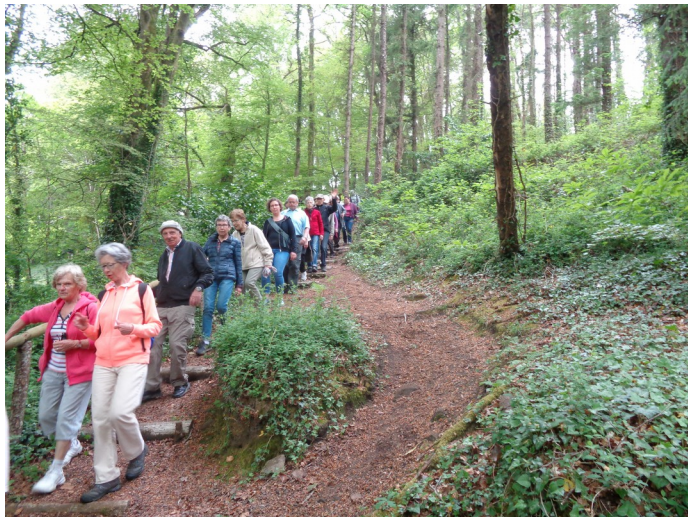
Les Diharzierien - Amoureux de la nature

Direction de la publication : Le Maire, Gaby LE GUELLEC - Comité de rédaction : Catherine Orsini, Jean-Marc Mescam, Ronan Kervarec