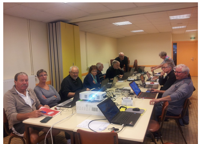
Encore et toujours