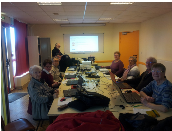
Des Pouldergat Geek's studieux